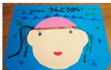
昨年度 こども園運動会