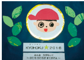
昨年度 保育園運動会

日程 橋北中学校 9月14日(木)、 橋北小学校 9月23日(土祝)、 橋北こども園 10月14日(出)