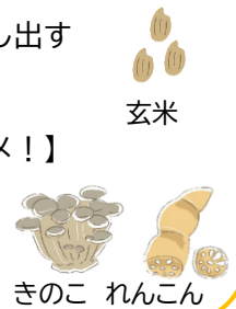
玄米 きのこ れんこん

詳しくは四日市市公式サイトにて・・・トップページ ライフメニュー【健康・医療】 →健康・医療・保健所→成人の健康づくり→必見！健康情報へ