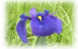
ノハナショウブ(5月頃)