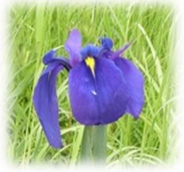
ノハナショウブ(5月頃)

自家用車をご利用の方は、8:30までに文化財整理作業所 (寺方町字北浦1506、四日市中央工業高校南側)にお越しください。