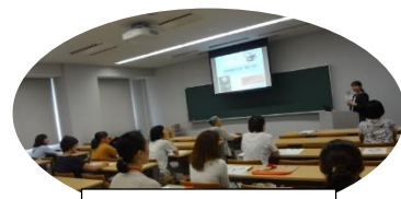
昨年度の受講風景