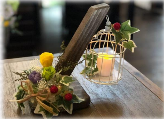
(本講座用にアレンジした「妖精の集う夜」)