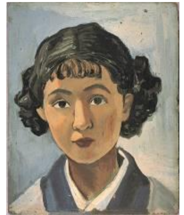
佐久間 修 「静子像」

会 期：7月18日（土）～9月6日（日） 開館時間：9：30～17：00（展示会の入場は16：30まで） 休 館 日：月曜日（祝休日の場合は翌平日） ※ただし8月11日（火）、31日（月）は開館 観 覧 料：一般1,000円、高・大生800円、中学生以下無料 会 場：そらんぼ四日市（四日市市立博物館） 4階 特別展示室