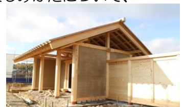
八脚門復元建築中写真