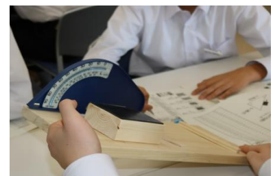
テーマ『もしも"まさつ"がなかったら?』