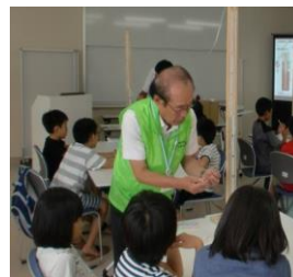
テーマ『空気の重さを感じますか?』