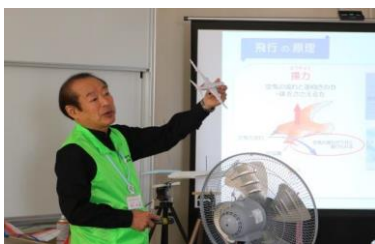
テーマ『飛行の原理と航空宇宙産業』