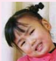
きょうかちゃん (3才)