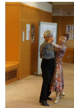
シャルウイダンス 社交ダンス