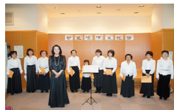
橋北綾合唱団のコーラス