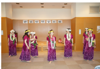
フラダンス滝川の踊り