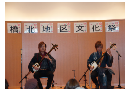
津軽三味線ユニット 「KUNI-KEN」演奏