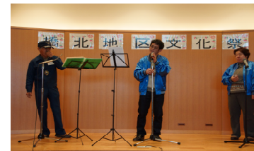
まっさん鼻笛会の演奏