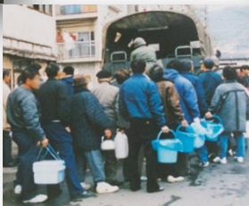
▲水の配給を受ける人たち