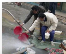
▲消防ホースから水を