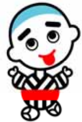
こにゅうどうくん

詳しくは四日市市ホームページにて トップページ（中央下）よく利用される情報 〔健康・医療〕 → 「健康情報」から